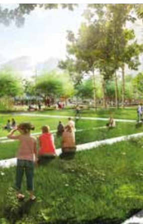
La Compagnie du paysage