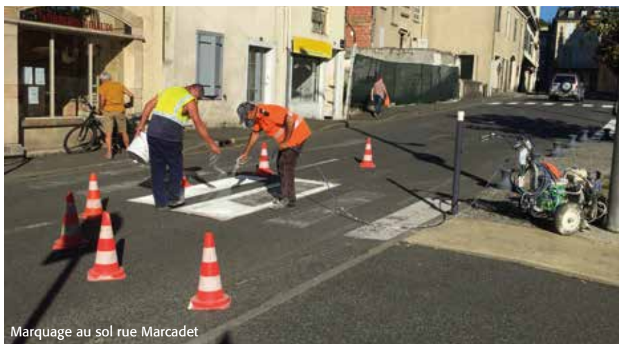
Marquage au sol rue Marcadet