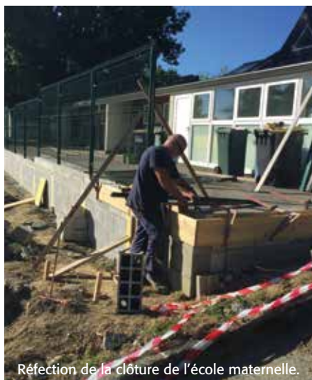
Réfection de la clôture de l'école maternelle.