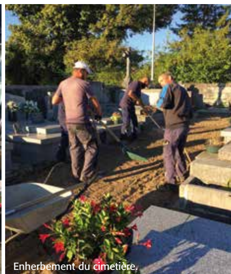
Enherbement du cimetière.

partagée avec un cheminement piétons et vélos séparés par un espace vert de la voie de circulation voitures. Cela permettra aux habitants et aux salariés de se rendre à l'école et dans les entreprises de manière plus sécurisée.