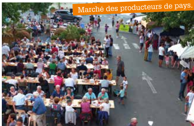
Marché des producteurs de pays.