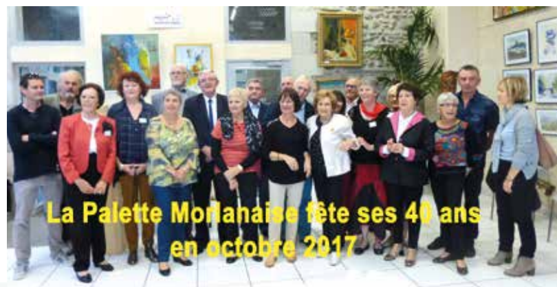
La Palette Morlanaise fête ses 40 ans en octobre 2017